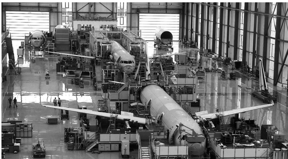
Fertigungshalle von Airbus in Hamburg: Mit dem »Eco-Design Software Tool« kann nun bereits in der Designphase ökobilanziert werden.